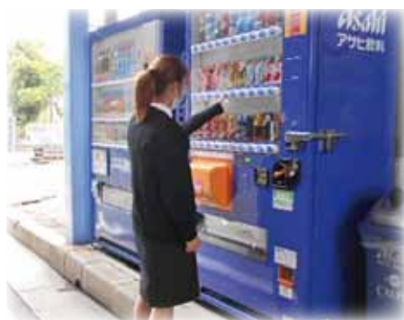
東陽倉庫株式会社弥富ふ頭倉庫様

気軽に社会貢献できる活動ですので少しでも興味がある方、気になる方は下記までご連絡ください。