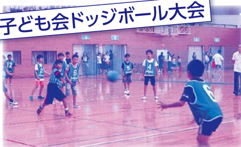
地区でチームを組みトーナメント戦を戦います