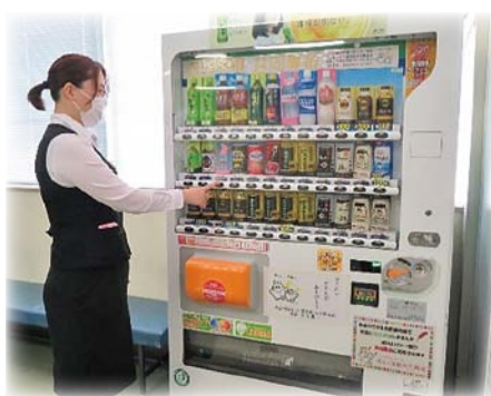
東海プレス工業株式会社様