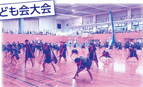
一生懸命ソーラン節を覚え、市子ども会会員で踊りました